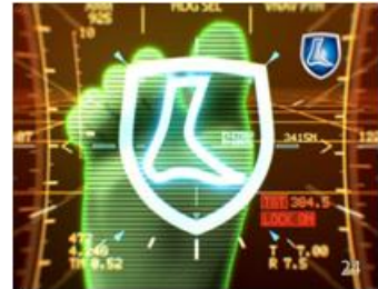
3 ラミシールプラスで