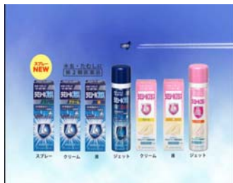
8 ラミシールプラス