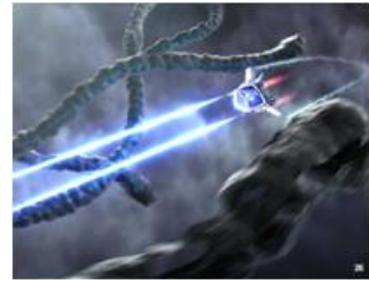
6 そして、しっかり殺菌せよ！