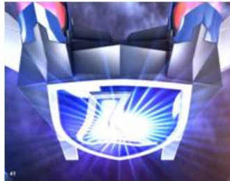
2 早く治せ！早く治せ！